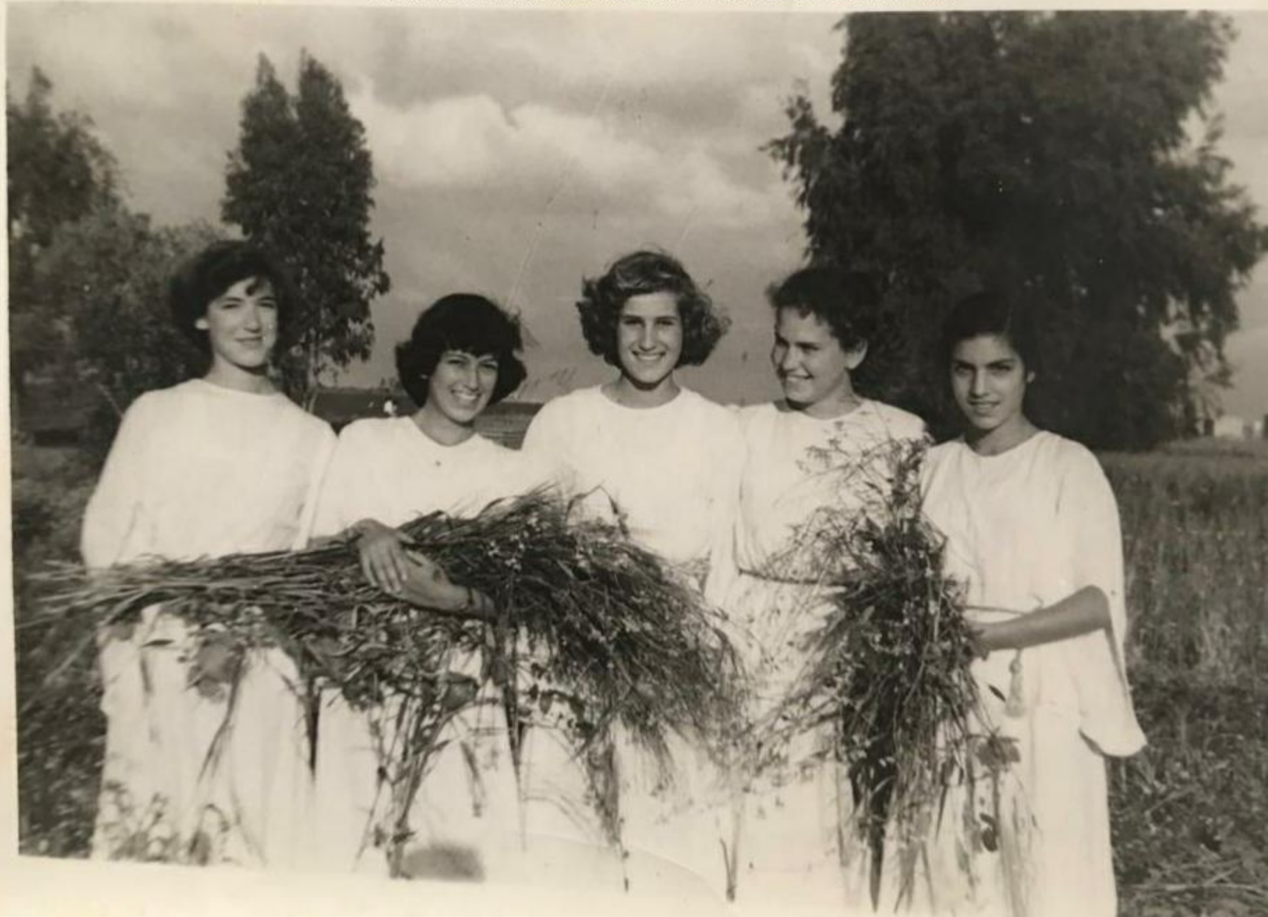
מחזור 6 (מסויימי 1958) בחג הביכורים בשנת 1955. התמונה נמסרה מתרסה שמואלי.